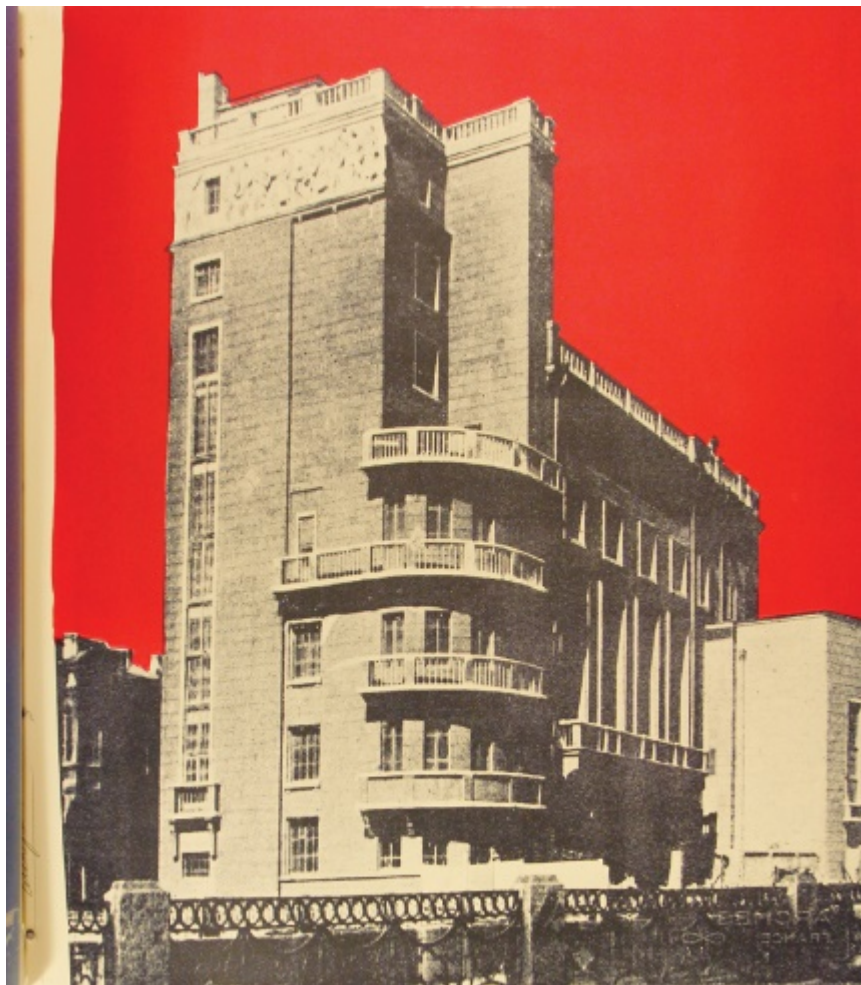
Рис. 12. Конструктивизм в фотографии.

В графических видах творчества (плакат и пр.) конструктивизм характеризовался применением фотомонтажа вместо рисованной иллюстрации, предельной геометризацией, подчинением композиции прямоугольным ритмам. Стабильной была и цветовая гамма: чёрный, красный, белый, серый с добавлением синего и жёлтого (см. рис. 12).