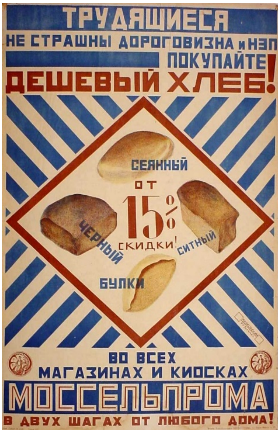
Рис. 8. Рекламный плакат Родченко.

Художественное движение футуристов подчеркивало превосходство технологий, скорости и промышленности в постоянно меняющемся мире. Дизайнеры и иллюстраторы сфокусировали свои усилия на том, чтобы дать представление о движении и масштабах своих проектов. Градиенты и текстуры в 3D-стиле также