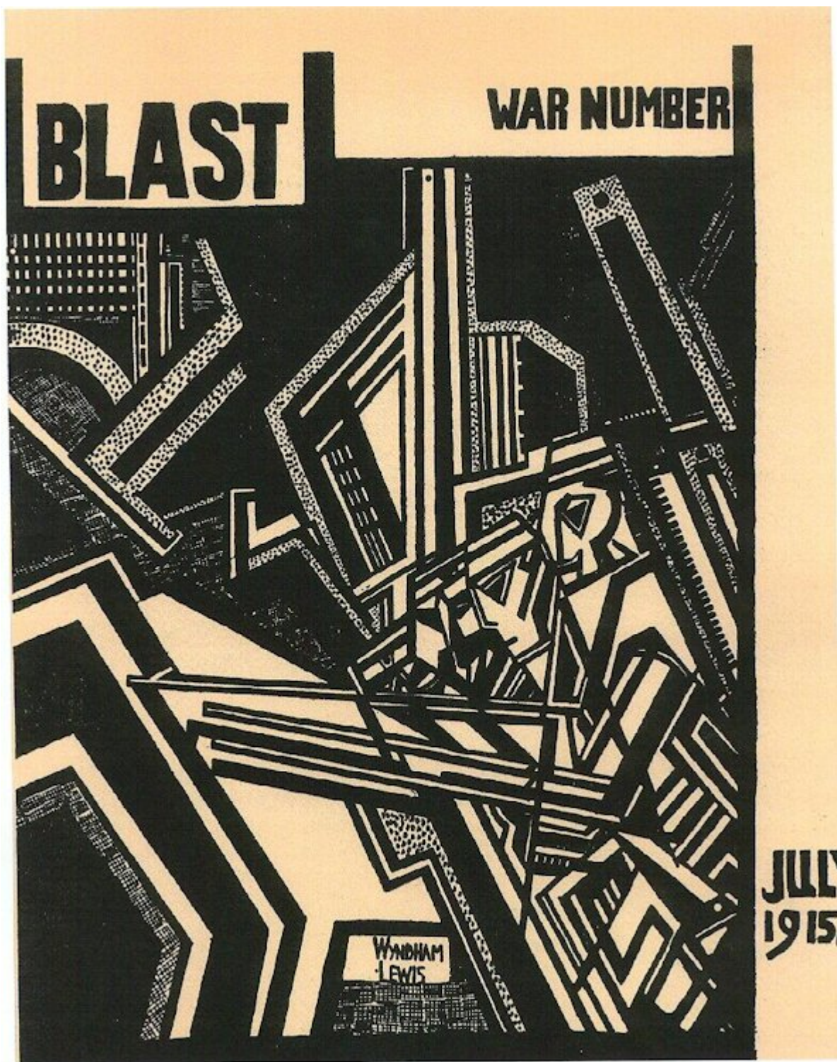
Рис. 16. Обложка журнала Blast (июль 1915 г.)

Вортицизм боролся с реалистическими тенденциями в живописи, отрицал моральный аспект искусства и настаивал на автономности каждого художественного творения. Кроме этого, вортицисты были антагонистами французской художественной школы и считали себя представителями нордического английского искусства. По их мнению, в духе