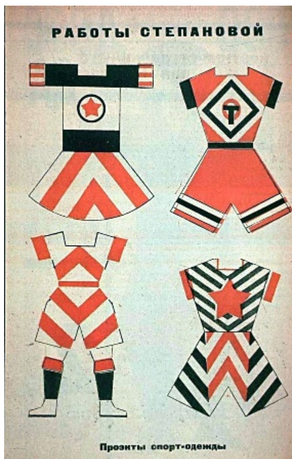
Рис. 14. Разработки спортивной одежды В. Степановой.

Самой известной фотомоделью тех лет была знаменитая Лиля Юрьевна Брик (см. рис.15).