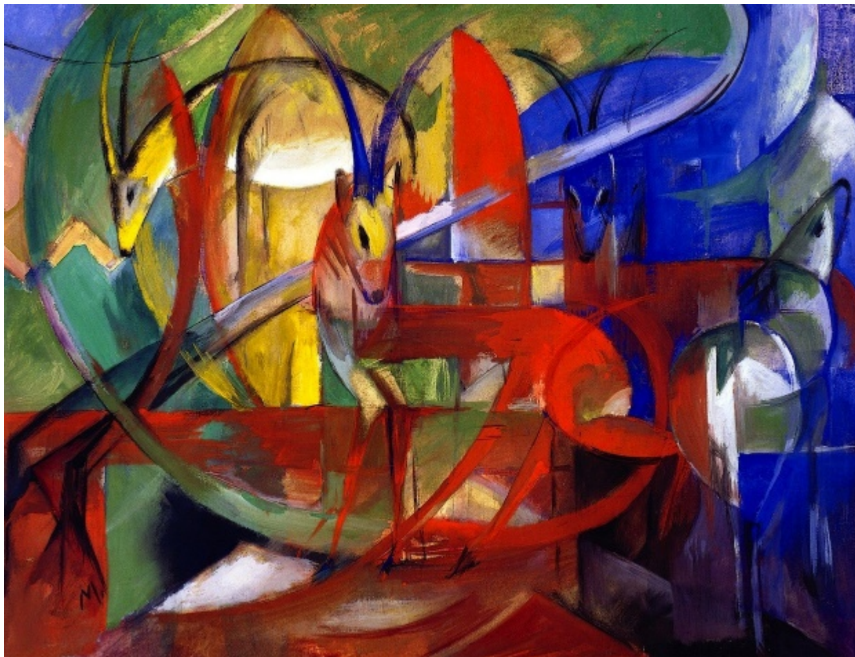
Рис. 2. Абстрактное искусство.

Модернизм — совокупность художественных направлений в искусстве второй половины XIX — середины XX столетия. Наиболее значительными модернистскими направлениями были импрессионизм, экспрессионизм, нео- и постимпрессионизм, фовизм, кубизм, футуризм. А также более поздние течения — абстрактное искусство (см. рис. 2), дадаизм (см. рис. 3), сюрреализм (см. рис. 4).