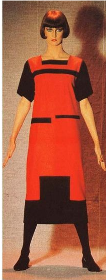
Рис. 13. Конструктивизм в моде.

Среди модельеров выделяется Варвара Степанова, которая с 1924 года вместе с Любовью Поповой разрабатывала тканевые рисунки для 1-й ситценабивной фабрики в Москве, была профессором текстильного факультета ВХУТЕМАСа, проектировала модели спортивной и повседневной одежды (см. рис. 14).