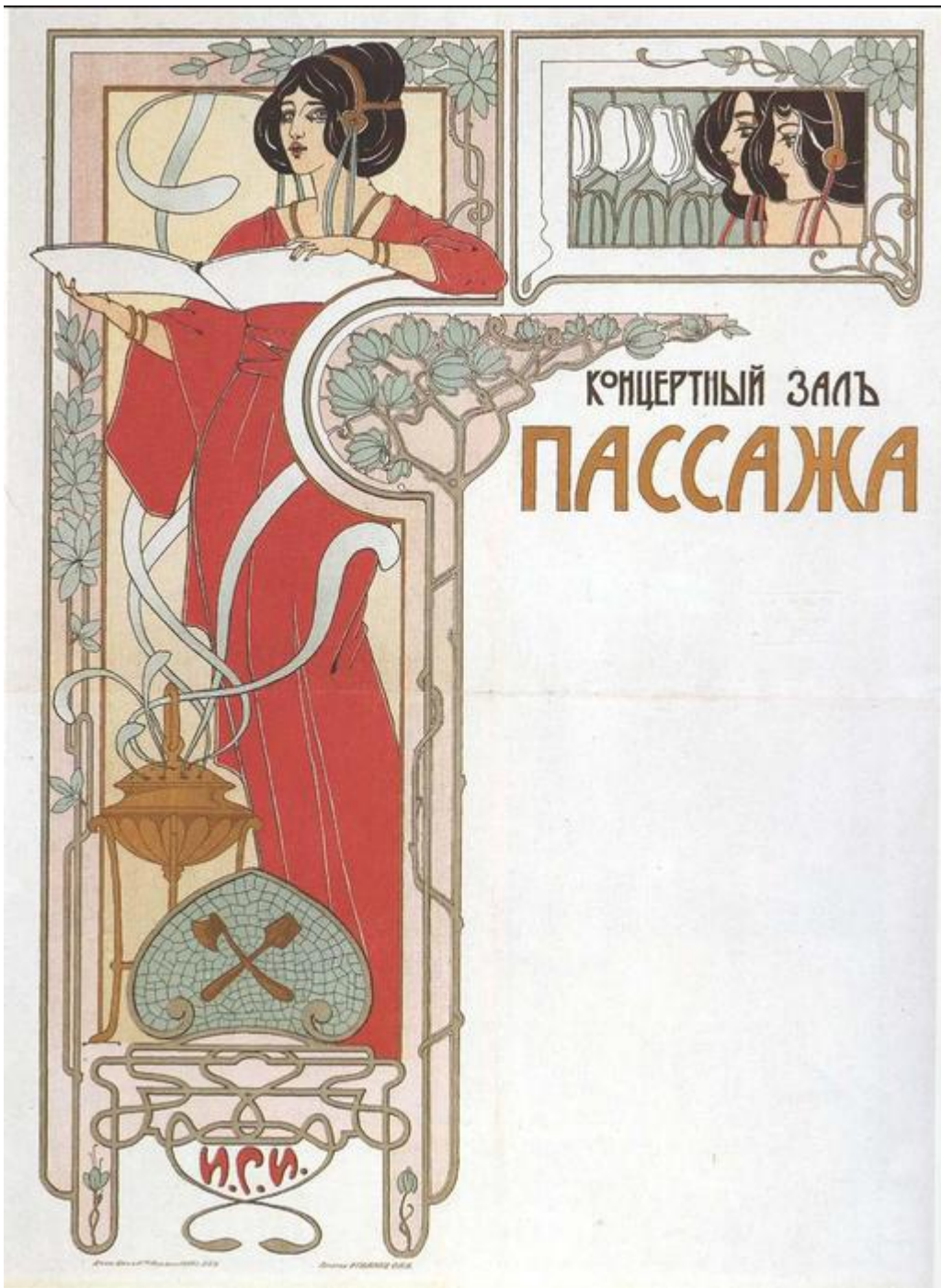
Рис. 1. Плакат.

«Модернизм» — широкое направление в культуре XX века, связанное с абстрактными и авангардными течениями, ориентированное на преодоление устоявшейся художественной традиции и построенное на последовательном стремлении к новизне.