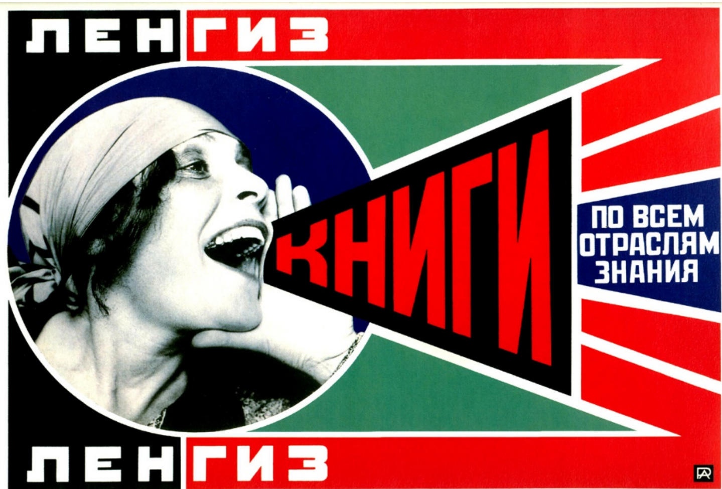
Рис. 5. Плакат Родченко.