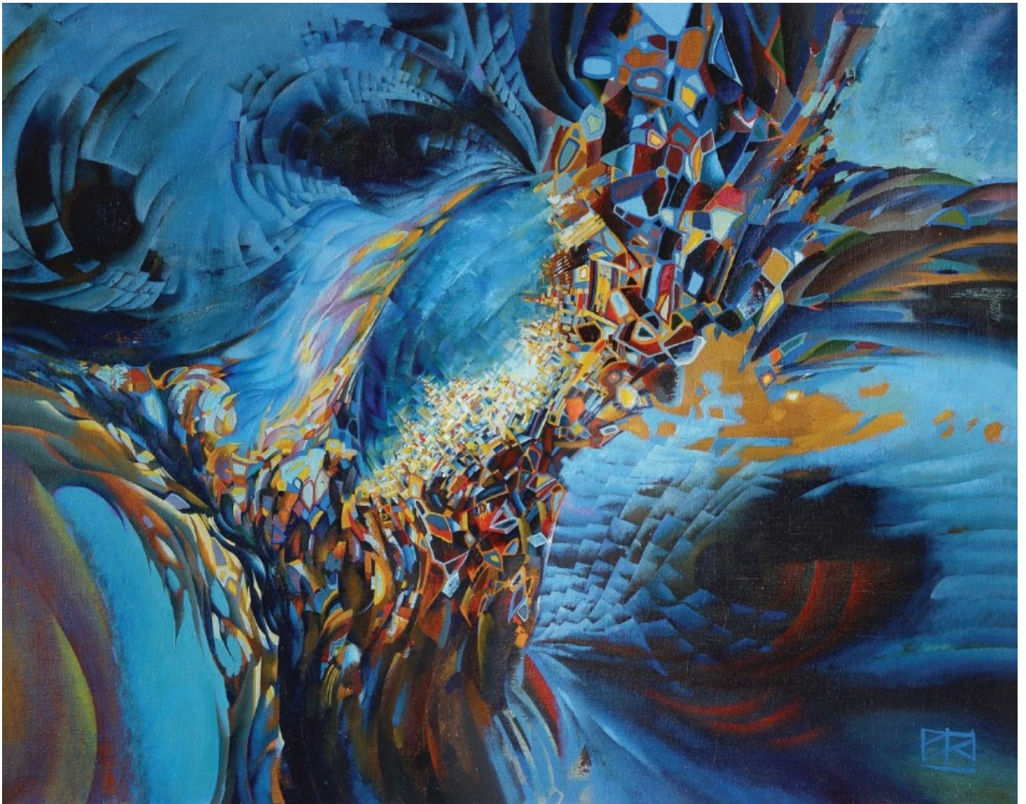
Рис. 4. Сюрреализм.

В узком смысле модернизм рассматривается как ранняя ступень авангардизма, начало пересмотра классических традиций. Датой зарождения модернизма часто называют 1863 год — год открытия в Париже «Салона отверженных», куда принимались работы, отвергнутые жюри Парижского салона. В широком смысле модернизм — «другое искусство», главной целью которого является создание оригинальных произведений, основанных на внутренней свободе и особом видении мира автором и несущих новые выразительные средства изобразительного языка, нередко сопровождающиеся эпатажем и определенным вызовом устоявшимся канонам. В первой половине XX века развитие модернизма было связано с развитием школы Баухаус и распространением идей Нового видения.