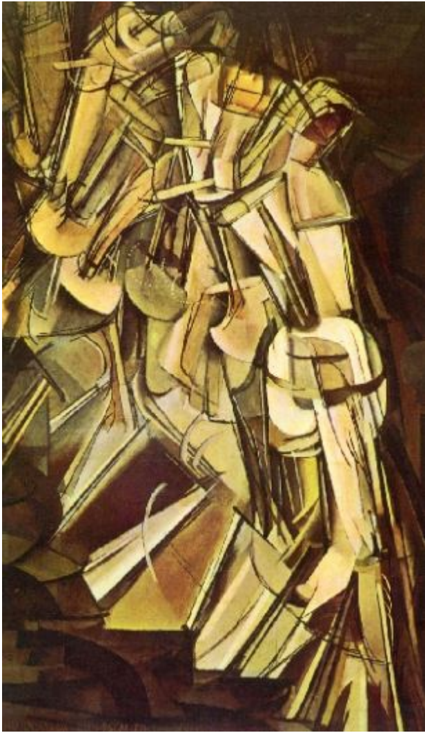
Рис. 3. Дадаизм.